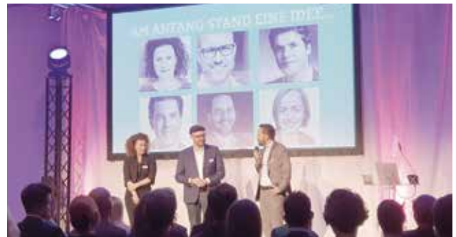
Jubiläumsfeier von Teach First Deutschland in Berlin.