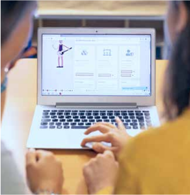
E-Learning Plattform MiA geht 2020 online!