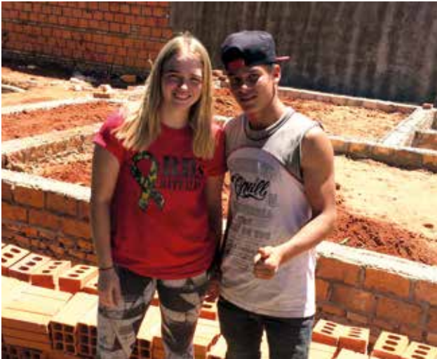
Freiwillige auf einer Baustelle des Wohnungsbauprojektes in Paraguay.