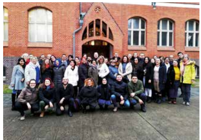
Teilnehmende des Multiplikatorenenaustauschs 2019 in Berlin.

Der Multiplikatorenenaustausch Deutschland-Türkei ist ein Projekt der Stiftung Mercator und des Deutschen Youth For Understanding Komitees e.V. (YFU) in Zusammenarbeit mit dem Pädagogischen Austauschdienst (PAD), des Sekretariats der Kultusministerkonferenz und IJAB – Fachstelle für Internationale Jugendarbeit der Bundesrepublik Deutschland e.V.