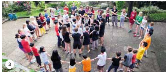
1: 4 Wochen verbringen die Jugendlichen in den „villages“. 2+3: Bei kreativen Aktivitäten, Spielen und Simulationen sammeln die jungen Menschen wertvolle Erfahrungen.