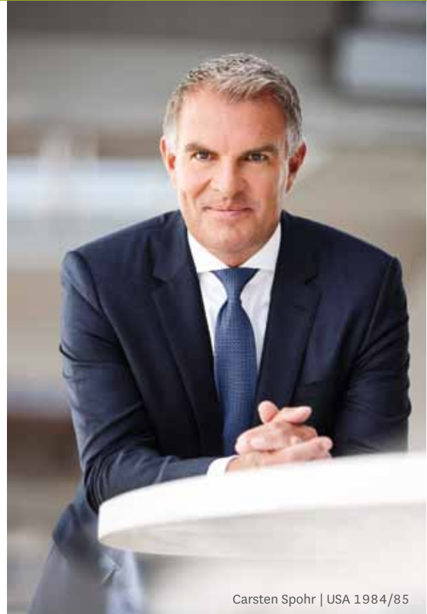
Carsten Spohr | USA 1984/85

Die Neugierde auf internationale Erfahrungen wurde deutlich größer. Wer seinen Lebensmittelpunkt einmal über nationale Grenzen hinweg verlagert hat, der möchte diese spannenden Erfahrungen, wenn möglich, ausbauen. Es ist daher sicher kein Zufall, dass mich mein beruflicher Werdegang immer wieder auf Positionen mit internationalem Bezug geführt hat. Als junger Nachwuchsmanager wurde ich Leiter des Allianz-Managements der Lufthansa. In dieser Aufgabe war ich viel unterwegs und habe mit Kooperationspartnern und Airlines der Star Alliance weltweit verhandelt. Heute treffe ich als Vorstandsvorsitzender der Lufthansa viele internationale Kollegen, und ich empfinde dies als einen spannenden Teil meiner Aufgabe.